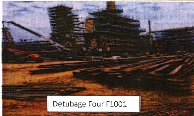
Detubage Four F1001