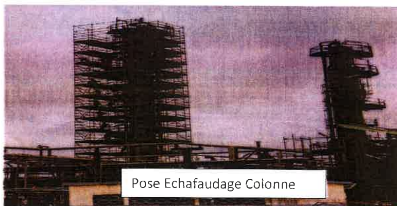
Pose Echafaudage Colonne